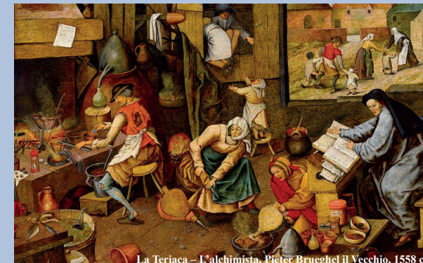
La Teriaca - L'alchimista, Pieter Brueghel il Vecchio, 1558 ca

Mercoledì 12 Febbraio 2020 dalle 14:00 alle 18:30