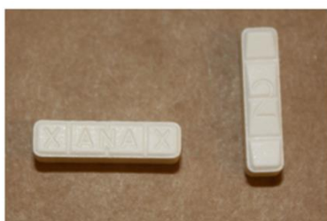
Figura 3: compresse di Xanax contraffatte contenenti ciclopropilfentanil

Tipicamente nel mercato illecito, i fentanili sono venduti come sostituzioni "legali" ad altri oppioidi illeciti e, senza che gli utilizzatori ne siano al corrente, vengono miscelati con o venduti come eroina e altri oppioidi illeciti. In alcuni casi sono anche usati per produrre medicinali contraffatti (falsi) (Figura 3) e, in misura minore, mescolati con o venduti come altre droghe illecite, come la cocaina. Una parte del mercato illecito riguarda la sottrazione dai canali leciti di distribuzione per l'uso medico di queste sostanze [9,10].